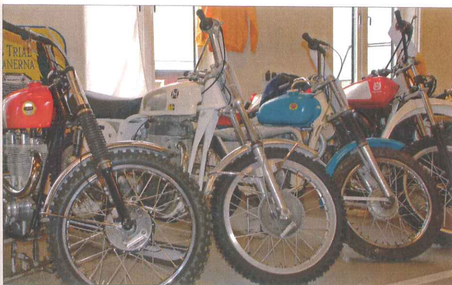
En bild från Cross & Trial Veteranernas monter, med Ariel HS, Hedlund, Lindström och Husqvarna cross.