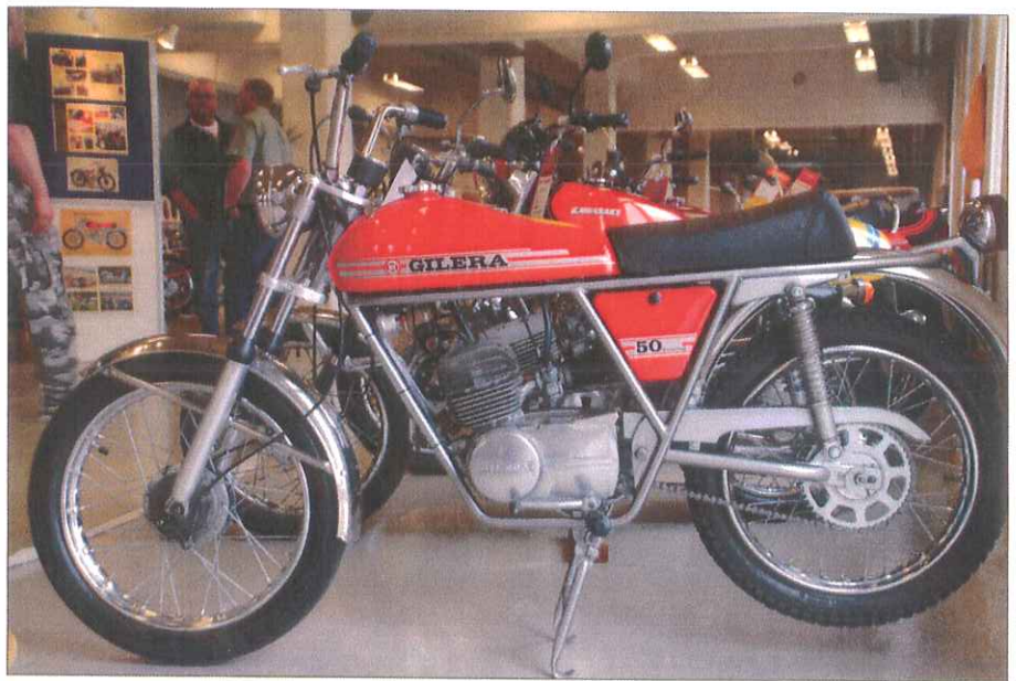
Gilera 50cc tvåtakt från 1975 var MCV-monterns nyaste fordon.

Manx-motor i ramen. Hade också en sådan motor på gång, när han blev erbjuden en begagnad AJS 7R av Ostermans för 2000 kronor. Den hade Varg-Olle Nygren tidigare tävlat med på olika TT-banor och den hade visst även varit med honom över till Isle of Man. Bill byggde en ny ram till denna, som var lämpad för motocross, samt ökade slagvolymen på motorn från 350 till 472cc. Han hade rådfrågat AJS om detta, men de hade avrått från att förstora motorn, då den inte skulle hålla för detta. När sedan Bill vunnit den första instiftade VM-titeln i motocross 1957 med denna maskin, kom AJS med en egen förstord motor i modellen G50. Enligt