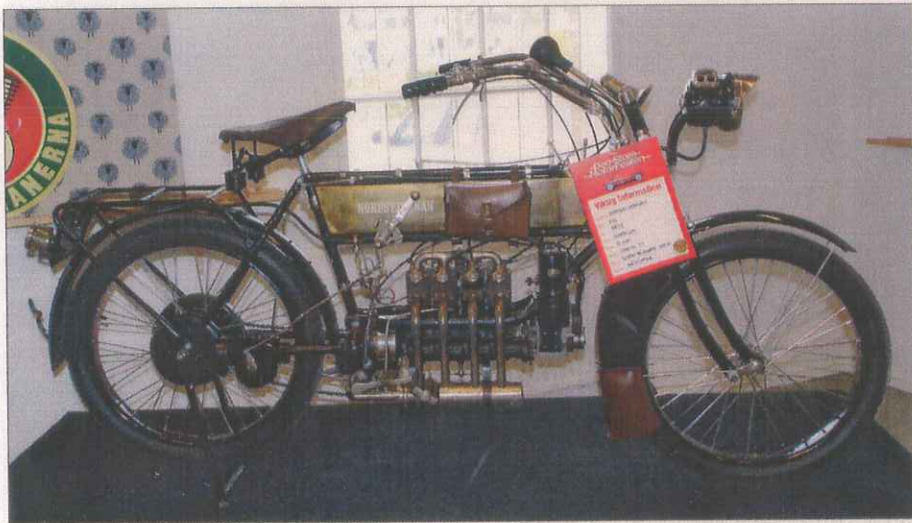
Nordstjärnan/FN fyrcylindrig 500cc från 1912 var mässans äldsta motorcykel.