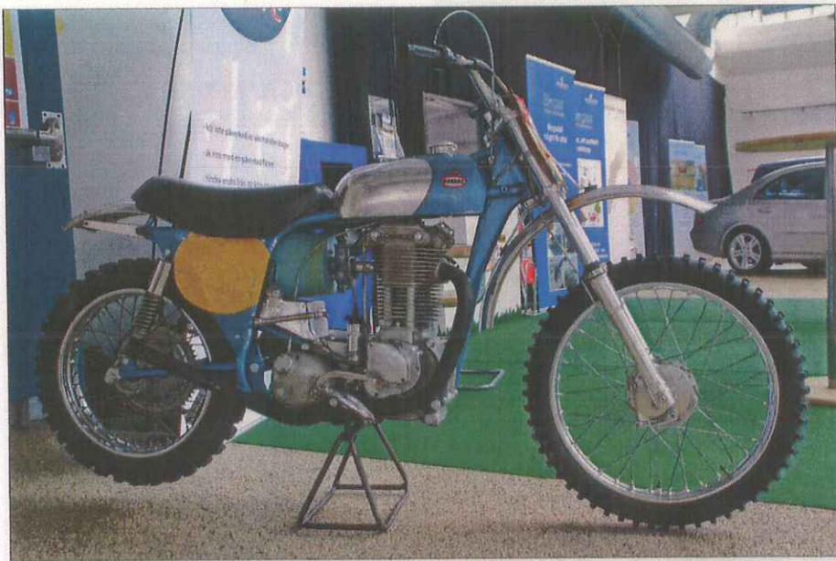
Sten Lundins Monark från åren som Världsmästare 1959 och 1961, som han tävlade med under ett tiotal år, men samtidigt viktbantade runt 20 procent.