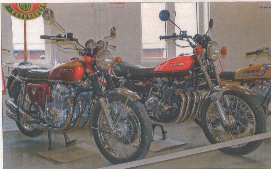
Honda CB750 1970 och Kawasaki 900 1973 får representera det japanska inslaget.