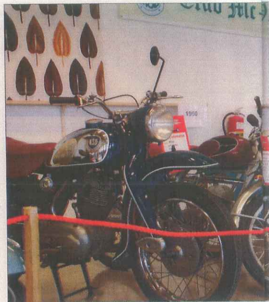
Några representanter från 60-talet.